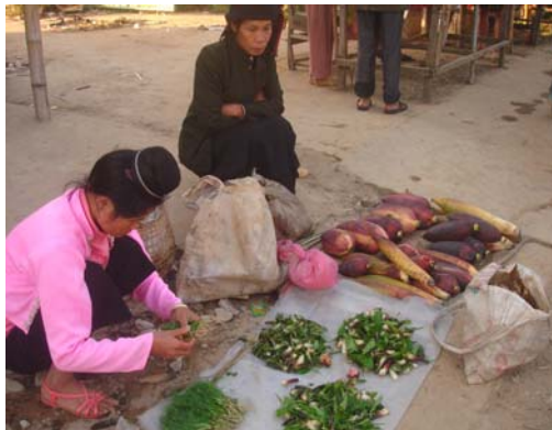
Hình 8: Bán rau rừng ở chợ Mường Phăng