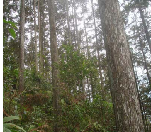
Hình 7: Rừng Sa Mộc 30 tuổi ở Tả Phìn