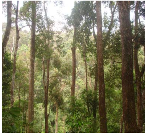
Hình 6: Rừng tự nhiên ở Mường Phăng