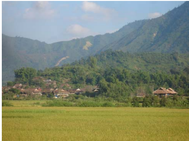
Hình 1: Bản Bua, Mường Phăng

Xã Mường Phăng có 47 bản, 1754 hộ gia đình với 8.319 nhân khẩu. Xã có đến 95% là đồng bào dân tộc thiểu số, trong đó chủ yếu là đồng bào Thái, Khơ Mú, còn người Hmông và người Kinh chiếm tỷ trọng nhỏ. Trong 47 bản có 36 bản là người Thái và 11 bản là người Khơ Mú, xen kẽ là người Hmông và người Kinh.