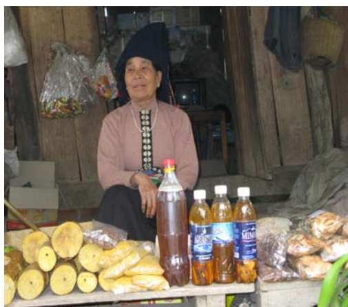
Hình 10: Bán thuốc chữa bệnh ở Mường Phăng