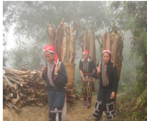
Hình 9: Thu hái củi ở Tà Phìn