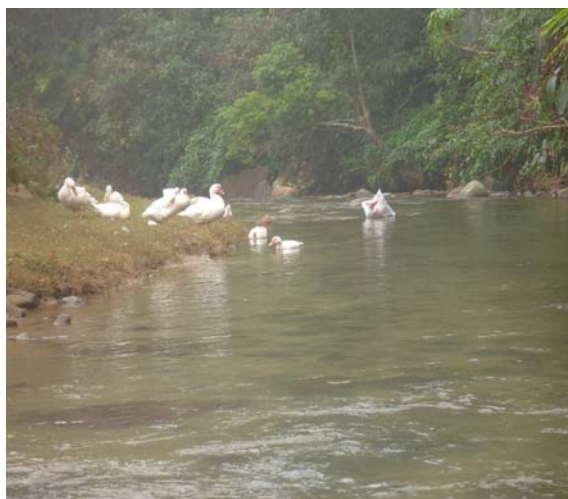
Hình 2: Suối Thầu, Tả Phìn

Tả Phìn có 2.718 ha đất tự nhiên, trong đó có 390 ha đất sản xuất nông nghiệp và 1.541 ha đất lâm nghiệp, trong đó có 1.284 ha rừng tự nhiên (83,32% đất lâm nghiệp). Đất ở Tả Phìn hình thành trên nền địa chất có nguồn gốc trầm tích nên hàm lượng các chất dinh dưỡng trong đất (như mùn, đạm, lân...) ở mức trung bình hoặc khá. Thành phần cơ giới đất thuộc loại thịt nhẹ hoặc trung bình, do vậy đất ở Tả Phìn phù hợp với các loại cây lâm nghiệp, dược liệu và cây nông nghiệp ngắn ngày. Rừng ở Tả Phìn có hệ thực vật phong phú, nhưng nhiều năm qua do khai thác quá mức và không theo quy hoạch, kế hoạch nên diện tích và trữ lượng rừng bị giảm nhiều, hiện tại diện tích rừng nghèo, rừng kiệt sau khai thác hoặc rừng tái sinh sau nương rẫy chiếm tỷ lệ chủ yếu. Tả Phìn không có khoáng sản, chỉ có đá vôi có thể khai thác để làm đường giao thông hay sử dụng để xây dựng các công trình kiến trúc.