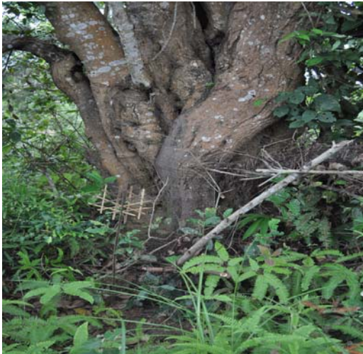
Hình 4: Ta Léo đặt ở cây cúng Xên Bản

Việc tổ chức cúng lễ bao gồm: chọn gia đình thường là họ Cầm – Lo Cầm , có người già, ăn nên làm ra, sống hạnh phúc để làm lễ cúng “ Chầu Sủ ”. Đồ lễ gồm: có 1 con lợn, 2 con gà (trường hợp bản có 3 đường vào/ra thì có 3 con, bản có 2 đường vào/ra thì cúng 2 con); 4 sải vải trắng, 4 sải vải kít, 1 chiếc vòng bạc (vòng tay); 4 chõ đựng xôi ( ép khẩu ), 4 chai rượu, 1 đĩa trầu cau, 2 bó hương, 2 cây nến, 1 chiếc ô (tự tạo bằng vải) để che mâm cúng, nước măng chua ( Sóm Ván ), trái cây ngọt, 1 bát gạo, 1 bát thóc, 2 bát hoa, mỗi bát cắm một cành, 8 chén rượu, 1 chén nước lã lấy tăm cho vào chén nước, 8 đôi đũa, 8 thìa, 2 bát canh, 1 bát tiết canh, 1 gói muối trắng, 1 chiếu trải mâm, 1 áo Thái dài cho thầy cúng và 1 áo của ông hội “ Chầu Sủ ”, khăn đen của “ Chầu Sủ ” giao cho thầy cúng để làm lễ, 1 khăn chít đen, 2 đĩa thịt lợn đã chế biến (bao gồm đủ các thứ như thịt lòng, tim, gan...). trên mâm có đặt lá cành cây (tượng trưng là Thần Rừng/Núi).