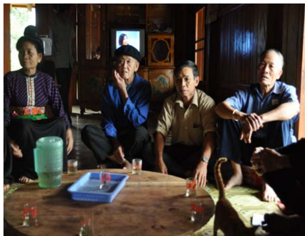
Hình 3: Thảo luận về Luật tục với Già làng người Thái tại Mường Phăng

Nội dung Luật tục hướng cho người dân làm việc thiện, yêu quý thiên nhiên, yêu quý đất, rừng và nước vì những tài nguyên này cho họ cuộc sống. Luật tục bao gồm các quy định trong cuộc