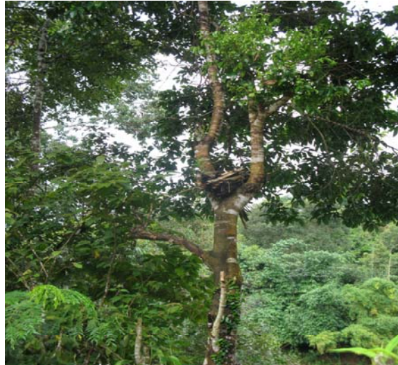
Hình 5: Đặt vỏ com lam lên cây