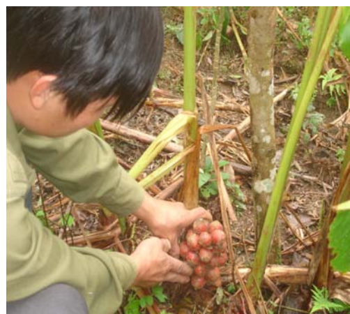
Hình 11: Thu hoạch Thảo quả ở Tả Phìn